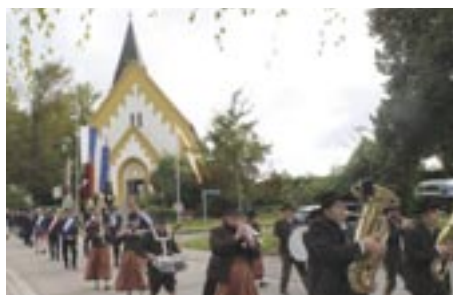
Festzug zum Feuerwehrhaus, wo die weltliche Feier stattfand.