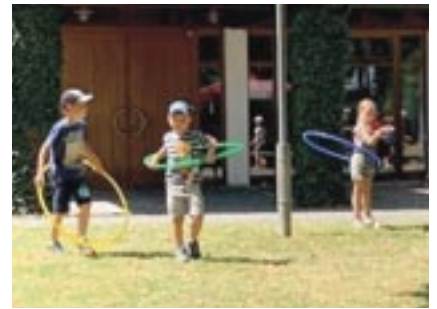
Das Spielmobil auf dem Schulsportplatz mit Bürgermeister Günter Gamisch.