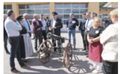
Die Funktion der Salutkanone wurde interessierten Zuschauern erklärt.

Im Dezember 1968 erfolgte die Wiederbelebung des Vereins, der sich nun in „Verein alter Soldaten Ehekirchen“ umbenannte. Ob zum 50-Jährigen Jubiläum im Juli 1974 die bestehende Fahne renoviert oder eine neue angeschafft werden sollte, führte seinerzeit zu Diskussionen. Mit 16 zu 13 Stimmen wurde der Kauf beschlossen, der mit Spenden von Bürgern und Geschäftsleuten finanziert wurde.