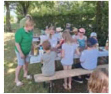
Dachplatten bemalt mit dem Gartenbauverein Ehekirchen-Schönesberg-Ambach.