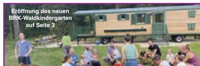
Eröffnung des neuen BRK-Waldkindergartens auf Seite 3

Den Abschluss bildete eine kleine Feier, die von der Gemeinde für die Gäste vorbereitet worden war.