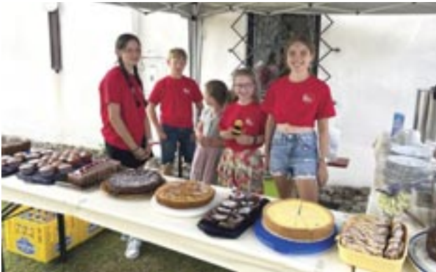
Nach dem Vortrag wurden die Besucher von den Ministranten mit Kaffee und Kuchen verköstigt.

Mayer noch auf sämtliche Figuren und das Deckengemälde ein. Die Orgel stammt aus dem Jahre 1896 und wurde bei der Renovierung 1999 um ein Register erweitert. Die Organistin Katharina Steiner begleitete die Führung mit zwei schönen Musikstücken. Erwähnenswert sind auch die Glocken von Ambach. Die kleine Glocke ist eine der Ältesten im Landkreis, sie stammt aus dem Jahre 1492 und wird Hosianna Glocke genannt. Die große Glocke stammt aus dem Jahr 1950, da ihre Vorgängerin im 2. Weltkrieg 1942 abgegeben werden musste. Die dritte Glocke stammt aus dem Jahr 1995 und ist eine Spende der Familie Steiner vom Kagerhof und wird Martins Glocke genannt. Zum Schluss berichtete Hr. Mayer noch über die Maria Hilf Bruderschaft in Ambach. Diese wurde von Pfarrer Michael Zöschinger im Jahr 1775 gegründet und ist heute noch ein wichtiger Bestandteil des Ortes. Hierzu wird an allen Marienfeiertagen im Jahr der Bruderschaftsrosenkranz gebetet und am 15. August der „Fraudog“ mit einem großen Fest gefeiert.